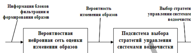
Рисунок 3 – Структурная схема использования вероятностной нейронной сети при управлении комбинированными системами водоочистки

применять их перед блоками принятия решений в системах управления комбинированными установками водоочистки (рис. 3).