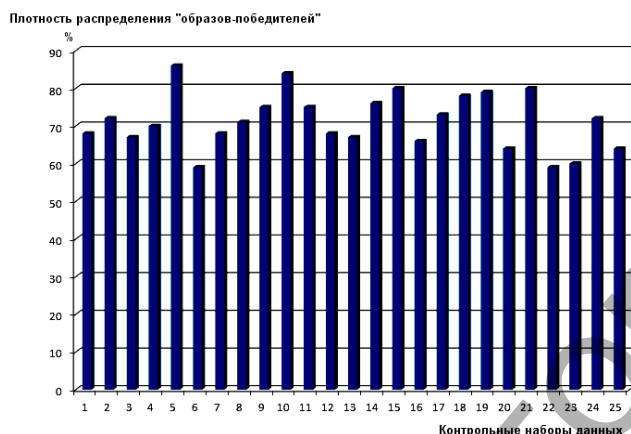
Рисунок 2 – Плотности распределение вероятностей при проверке эффективности PNN-сети

Вероятностная нейронная сеть верно классифицировала все наборы с четким преимуществом на выходе слоя добавления плотности распределения вероятностей соответствующих образов-победителей (рис. 2).