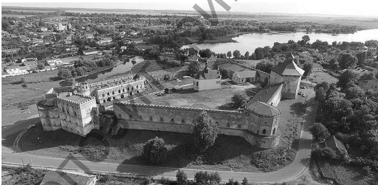
Рисунок 2 – Меджибожский замок [7]

никак не используется. Исторически здание было прямоугольное в плане с внутренним двором. Его северную часть формировала ратуша, которая также была разобрана в XX веке.