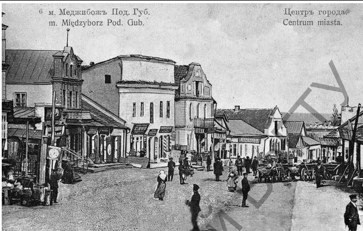
Рисунок 1 – Главная торговая улица, соединяющая замок и рыночную площадь. Иконография [6]